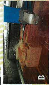
Fabrication assistée par ordinateur