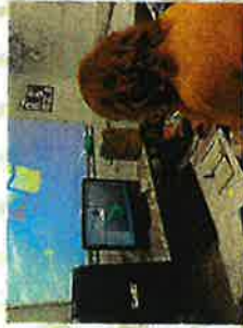
Conception assistée par ordinateur.